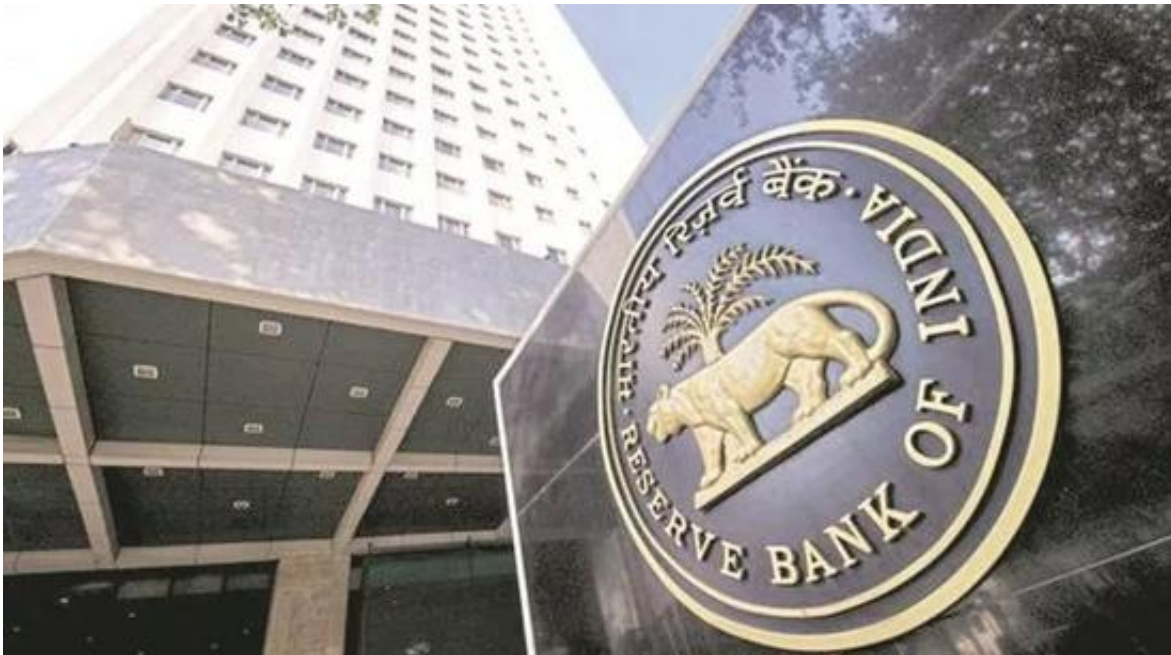
▲印度储蓄银行

增加的余地，而且去年也动用了这一手段；印度储蓄银行（央行）已经清除了接纳这种手段的可能性。